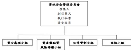
圖 1：資訊安全組織架構圖

本資訊安全管理委員會由資源群最高主管擔任召集人，管理部最高主管擔任副召集人，並指派一名執行秘書，負責資訊安全管理委員會各項協調工作。各險部與資訊安全相關部門均應指派代表加入資訊安全管理委員會，並將人員名冊列在資訊安全組織名冊。